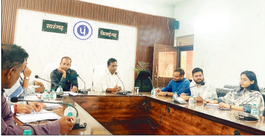
बैठक लेते कलेक्टर।

अभियंता ग्रामीण यांत्रिकी सेवाएँ सीएमओ नगरपालिका सारंगढ़ आदि अधिकारियों की बैठक ली। बैठक में जिलेभर में जल संरक्षण एवं संवर्धन के लिए चलाए जा रहे जल संगवारी अभियान के अंतर्गत जनभागीदारी एवं योजनाओं के